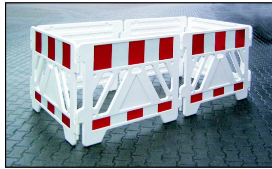
1300 x 2700 mm