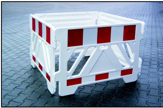
1300 x 1300 mm